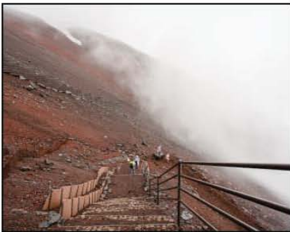
ความชันของทางขึ้นช่วงสถานี 6-7