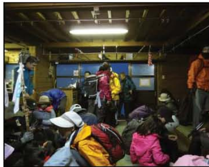
ที่นอนซึ่งเป็นเตียงสองชั้นบนยอด