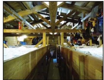
นักปีนเขาเข้าเช็คอินที่บ้านพัก

ภูเขาไฟฟูจิหรือ ฟูจิซัง เป็นสัญลักษณ์สำคัญ และยังเป็นภูเขาที่มียอดสูงสุดในญี่ปุ่น (3,776 เมตร) ชาวญี่ปุ่นยกย่องให้เป็น 1 ใน 3 ภูเขาศักดิ์สิทธิ์ของประเทศ เส้นทางปีนเขาบนฟูจิจึงกลายเป็นที่นิยมของทั้งชาวญี่ปุ่นและนักท่องเที่ยวต่างชาติทางการญี่ปุ่นเปิดให้นักท่องเที่ยวสามารถเดินขึ้นภูเขาไฟฟูจิได้เฉพาะช่วงฤดูร้อน เนื่องจากในช่วงอื่นของปีมีอากาศหนาวเย็นและมีหิมะปกคลุม ซึ่งอาจเป็นอันตรายแก่นักท่องเที่ยวได้ สำหรับปี 2019 เส้นทางปีนเขาเปิดให้นักท่องเที่ยวสามารถขึ้นชมพระอาทิตย์ขึ้นบนยอดภูเขาไฟตั้งแต่วันที่ 1 กรกฎาคม ถึง 10 กันยายน หากคุณอยากหลีกเลี่ยงความหนาแน่นของนักท่องเที่ยว แนะนำให้วางแผนเดินทางมาในวันธรรมดา เพราะช่วงวันหยุดนักท่องเที่ยวจะไปด้วยผู้คน บางช่วงของเส้นทาง คนเบียดกันจนแทบเดินต่อไม่ได้ เส้นทางที่ได้รับความนิยมสูงสุดคือโยชิเดะ (Yoshida Trail) เพราะเป็นเส้นทางที่เดินค่อนข้างง่าย เหมาะกับคนทั่วไปที่ไม่มีประสบการณ์ในการปีนเขา อีกทั้งยังมีสิ่งอำนวยความสะดวกตามจุดต่างๆ ทั้งห้องน้ำ ห้องปฐมพยาบาล หรือบ้านพักที่มีให้เลือกตลอดเส้นทางตั้งแต่สถานีที่ 7 ขึ้นไป เส้นทางโยชิเดะเริ่มจากฟูจิซุบาร์ไลน์ หรือสถานีที่ 5 (5th Station) เราวางแผนมาตั้งหลักและพักค้างคืนที่ควาคุจิโกะหนึ่งคืนเพื่อนั่งรถรอบ 07:30 น. จาก